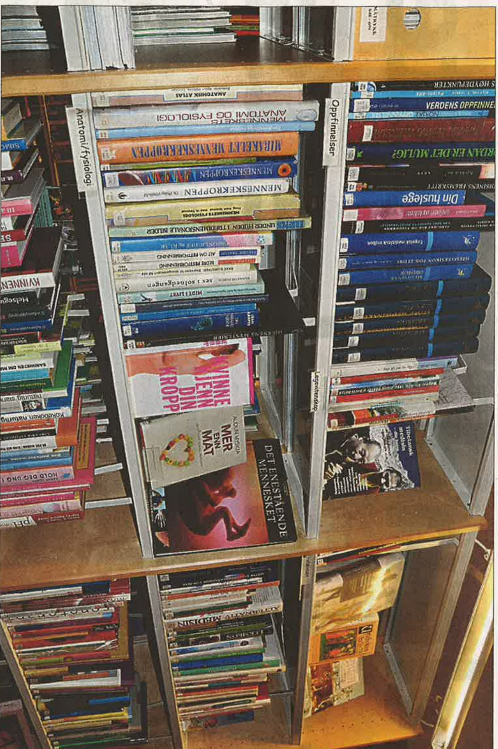
BEGRENSET: Lokalbiblioteket har sine begrensede hyller med helsestoff, som er mest av populær vitenskapelig sjanger.