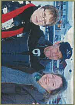
Vil skape eldretivsel