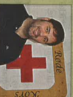
Bingo skal gi pusterom