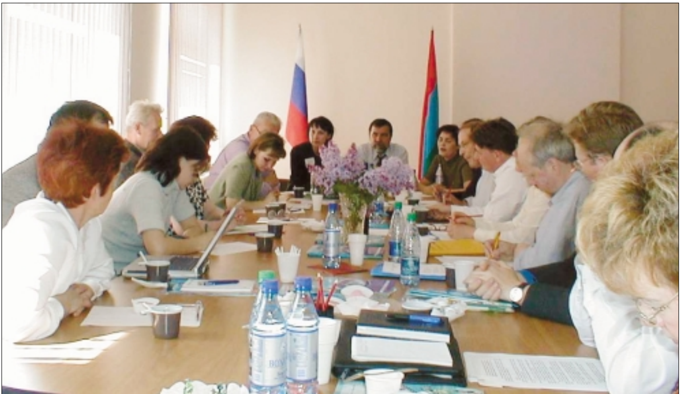
Members of the project groups are discussing vaccination at Karelia SEC, Petrozavodsk/Члены рабочих групп по проектам иммунизации обсуждают вопросы вакцинации в ЦГСЭН Республики Карелия, Петрозаводск

Финансирование проектов иммунизации через Баренц-программу