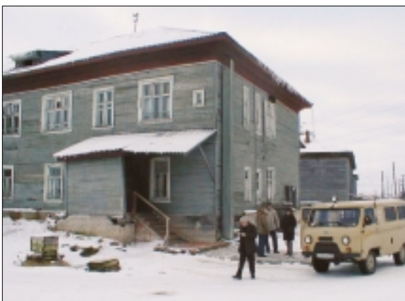
Department of Infectious Diseases, Naryan-Mar/Отдел контроля за инфекционными заболеваниями, г. Нарьян-Мар

An extra day was used for visits to the Department of Infectious Diseases (situated in an old building erected by the Norwegian merchant Martin Olsen), and the main hospital. The Department of Infectious Diseases will soon move into a new building.