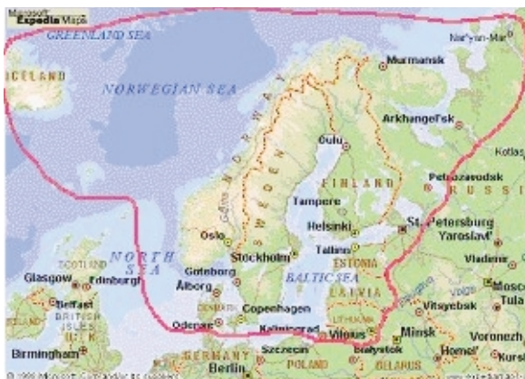
The project area/Территория проекта

The Nordic Council of Ministers (NCM) funded the project “Infectious disease control in the Barents and Baltic Sea Regions 1998-2001” (the Nordic project) which continued in a reduced form in 2002. The approximately 95.000 USD granted this year was used for funding EpiNorth, the advanced course in epidemiology of infectious diseases in St. Petersburg, and the network between the Nordic institutes and partners in the Estonia, Latvia, Lithuania and Northwest Russia.