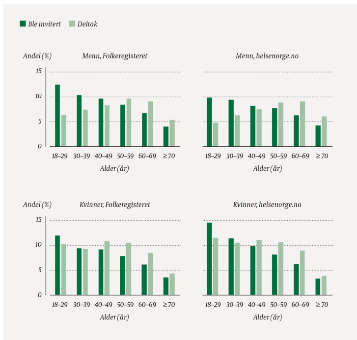
Figur 3 Alders- og kjønnsfordeling i to utvalg, trukket fra henholdsvis Folkeregisteret og helsenorge.no, fra Folkehelseundersøkelsen i Hordaland 2018. Inviterte og deltakere.

Bildet blir ytterligere nyansert når vi analyserer på undergrupper. Figur 3 viser aldersfordelingene i de to utvalgene separat for menn og kvinner. I alle alderskategorier var det litt flere menn enn kvinner som ble invitert i folkeregisterløsningen. I helsenorge.no-løsningen var det flest kvinner som ble invitert med unntak av de eldste alderskategoriene (> 60 år). Den største skjevheten finnes blant de yngste i helsenorge.no-løsningen, der andelen kvinner var nesten halvannen gang høyere enn andelen menn. Denne overrepresentasjonen forsterkes ytterligere av at deltakelsen blant yngre menn var noe lavere i helsenorge.no-løsningen enn i folkeregisterløsningen. Underrepresentasjonen av menn var større i helsenorge.no-utvalget enn i folkeregisterutvalget i alle de tre yngste aldersgruppene.