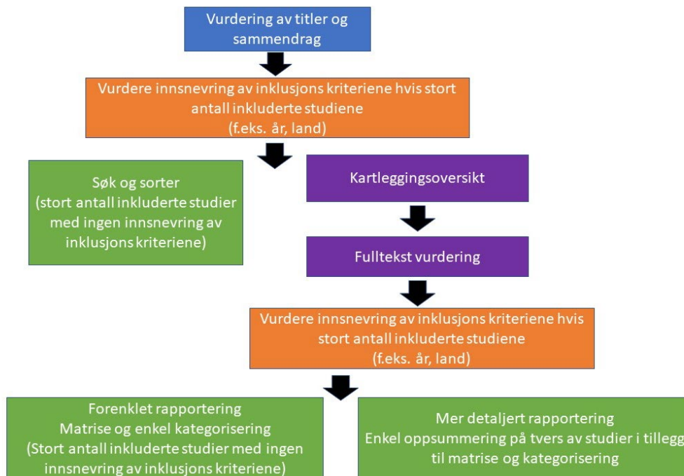
Figur 2: Beslutningstre for hvilket sluttprodukt som skal leveres