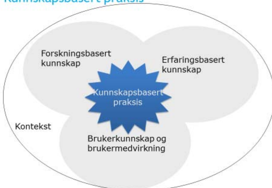
Figur 2. Kunnskapsbasert praksis.