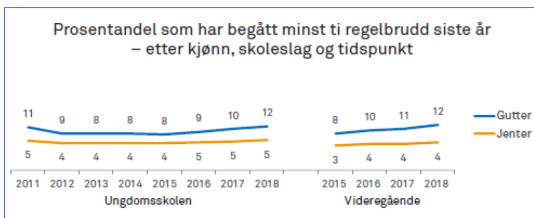
Figur 2. Utvikling siste tiår mht. regelbrudd – graf fra Bakken 2019 (Ung i Norge)

I Skogen og Torviks rapport (3) presenteres tall fra Ung i Norge-undersøkelsen publisert i 2001. Vi fant ikke eksakt samme data fra i dag, men Ung i Norge 2019 beskriver utviklingen over tid for ulike typer regelbrudd (34). Ungdata baserer seg på selvrapportering (spørreskjema) og gir informasjon om noen typer regelbrudd, f.eks. hæververk, slåssing, nasking, snike på kino/buss/arrangement. Fra 2011 til 2015 var omfanget av regelbrudd enten stabil eller nedadgående, mens tall for de siste årene tyder på at utviklingen kan ha snudd og at denne atferden nå viser en økning, særlig blant guttene (figur 2).